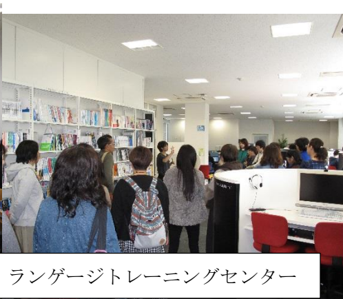
ランゲージトレーニングセンター